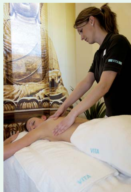
Kompetent: Vita Med bietet auch eine komplette Physiotherapie mit allen Zulassungen.

Physiotherapie mit allen Zulassungen, der Rehabilitationssport (bis zu 50 Einheiten nach ärztlicher Verordnung), Rückengymnastik, Cardio-Training, Präventionskurse, modernes Gerätetraining und ein umfangreiches Kursangebot wie zum Beispiel Pilates gehören weiter zu den Angeboten von „Vita Gesundheit“ genauso wie die Integrierte Versorgung, die Betriebliche Gesundheitsfürsorge (BGF) sowie Selektivverträge.