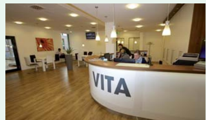
Großzügig: Vita Gesundheit, hier der Empfang, verfügt über eine Fläche von 1100 Quadratmetern.

Zu einem Gesundheitszentrum der ganz besonderen Art entwickelt sich das Facharztzentrum an der Mersch: