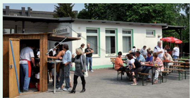
Das nahegelegene Schützenheim konnte für das Mieterfest genutzt werden.

Eindeutige Haupt-Attraktion für die Kinder war die große Hüpfburg. Die Einnahmen dieses Tages wurden den Jugendsportschützen gespendet. Auch der Bauverein zeigte sich spendabel: Der Schützenkönig des Tages hat eine Monatsgrundmiete gewonnen.