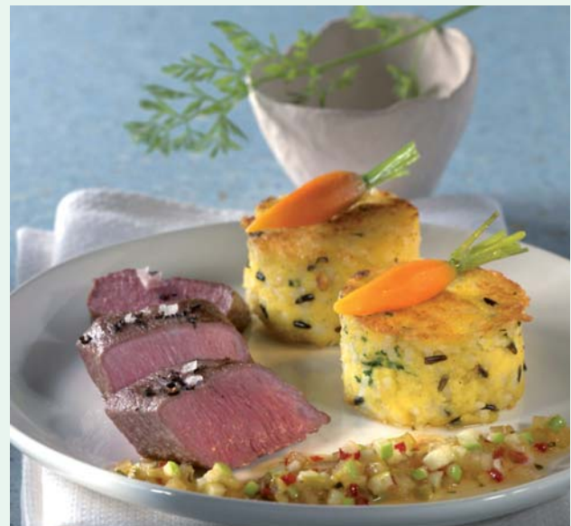
Lammrücken mit Apfel-Chili-Chutney und Wildreis-Polentatörtchen – ein Weihnachtstraum für Genießer.

Für weitere vier bis fünf Minuten ruhen lassen. Inzwischen die Polentatörtchen ebenfalls beidseitig anbraten und in den Ofen geben. Den Lammrücken mit Salz und Pfeffer würzen, aufschneiden, mit den Törtchen und dem Gemüse anrichten. Das Apfel-Chili-Chutney dazu servieren.