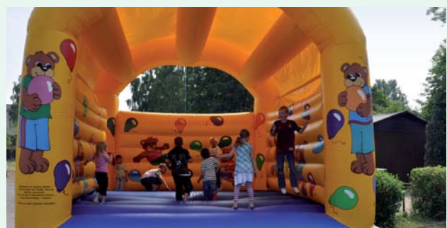
Großer Kinderspaß: Die Hüpfburg