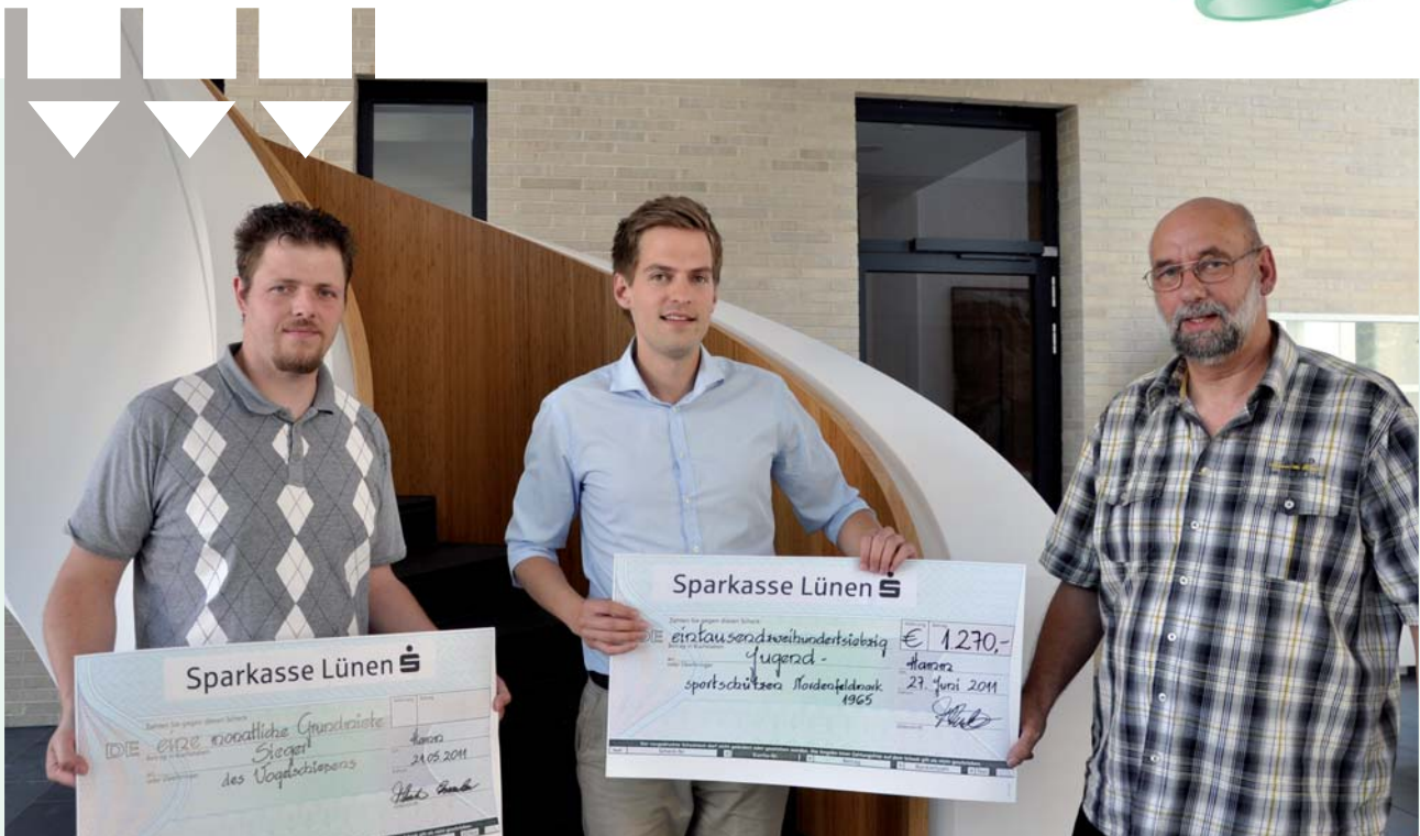
Schützenkönig: Der Sieger des Wettbewerbs erhielt vom Bauverein eine Gutschrift.