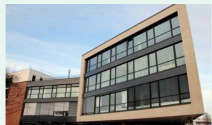
Meilenstein: Das Gesundheitszentrum ist zur Lippe ausgerichtet und überzeugt durch eine optimale Lage mit kurzen Wegen.